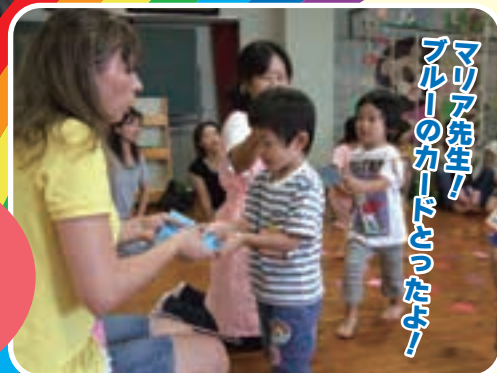
マリア先生！ ブルーのカードとったよ!

※10月には、ちびっこクラブさんだけの運動会をします。 ※車椅子でのご参加も、障害のあるお子さんもご入会出来ます。 ※定員50名(令和2年4月2日～令和3年4月1日生まれまでの2歳児さん) ※定員25名(令和3年4月2日～令和5年4月1日生まれまでの1歳児さん) (先着順です)