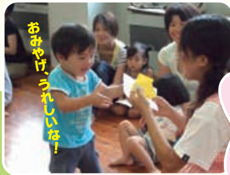
おみやげ、うれしいな!